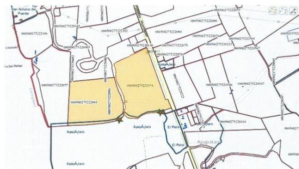
Imagen de referencia: Infraestructura de Datos Espaciales Catastro Querétaro

B) Que los predios en cuestión se encuentran dentro del límite normativo del Programa de Ordenamiento Ecológico Local de Huimilpan. Aprobado por el Ayuntamiento de Huimilpan en el Décimo Segundo Punto del Orden del día en el Acta no. 077, relativo a la Sesión ordinaria celebrada el 28 de marzo de 2018, publicado en el periódico oficial del Estado de Querétaro "La Sombra de Arteaga" no. 32 de fecha 20 de abril de 2018 e inscrito bajo el folio Plan de Desarrollo no. 00000048/0004 de fecha 5 de junio de 2018 en el Registro Público de la Propiedad y el Comercio, Subdirección Querétaro y bajo el folio Plan de Desarrollo no. 00000006/0002 de fecha 5 de junio de 2018, en el Registro Público de la Propiedad y el Comercio Subdirección Amealco. Mismo que establece lo siguiente para los predios en comento: