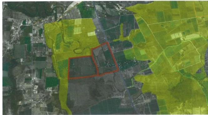
Imagen de referencia, Programa de Ordenamiento Ecológico Local