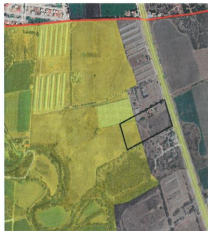
UGA 08 APROVECHAMIENTO SUSTENTABLE

V. En análisis del predio en comento, se identificó que se encuentra dentro del límite normativo de Programa de Ordenamiento Ecológico Local de Huimilpan, Qro., instrumento Aprobado por el Ayuntamiento de Huimilpan en el Décimo Segundo Punto del Orden del día en el Acta no. 077, relativo a la Sesión ordinaria celebrada el 28 de marzo de 2018, publicado en el periódico oficial del Estado de Querétaro "La Sombra de Arteaga" no. 32 de fecha 20 de abril de 2018 e inscrito bajo el folio Plan de Desarrollo no. 00000048/0004 de fecha 5 de junio de 2018 en el Registro Público de la Propiedad y el Comercio, Subdirección Querétaro y bajo el folio Plan de Desarrollo no. 00000006/0002 de fecha 5 de junio de 2018, en el Registro Público de la Propiedad y el Comercio Subdirección Amealco. El cual establece que el predio se encuentra inmerso en la UGA 08 Aprovechamiento Sustentable y UGA 02 Desarrollo Urbano, con los siguientes lineamientos: