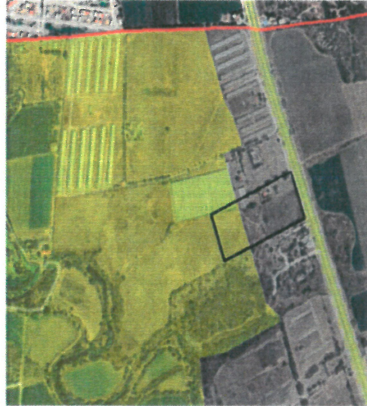
UGA 08 APROVECHAMIENTO SUSTENTABLE

2018, en el Registro Público de la Propiedad y el Comercio Subdirección Amealco. El cual establece que el predio se encuentra inmerso en la UGA 08 Aprovechamiento Sustentable y UGA 02 Desarrollo Urbano, con los siguientes lineamientos: