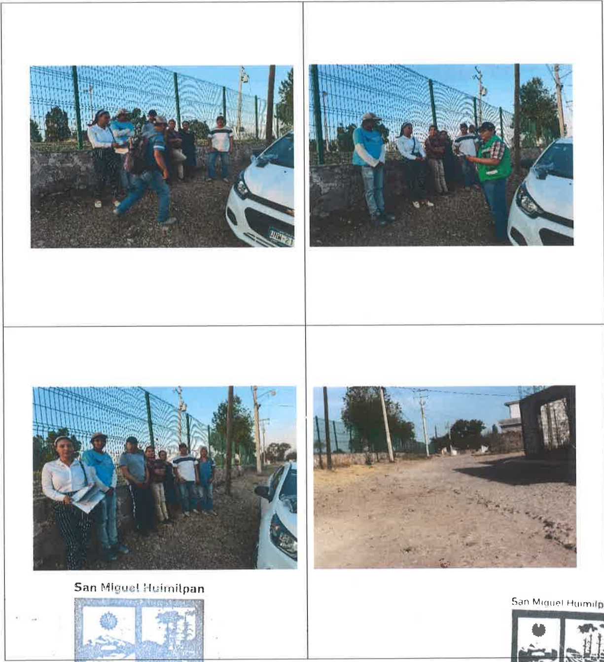
San Miguel Huimilpan

FOTOGRAFÍAS DE LA CAPACITACIÓN AL COMITÉ DE PARTICIPACIÓN SOCIAL